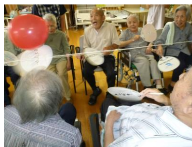
うちわで風船バレー…