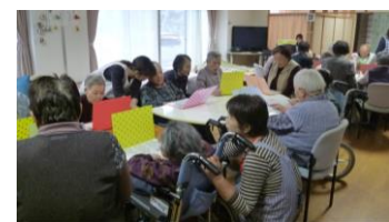
スイングエコーさんと…