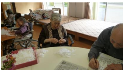
それぞれの 手作業